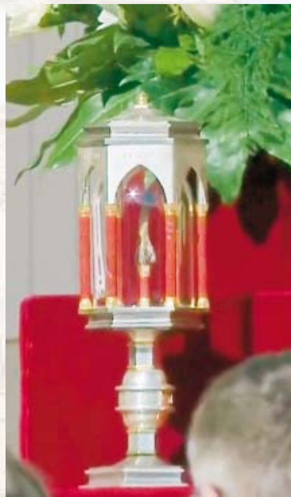
Reliquia di San Lodovico Pavoni - Osso del piede destro