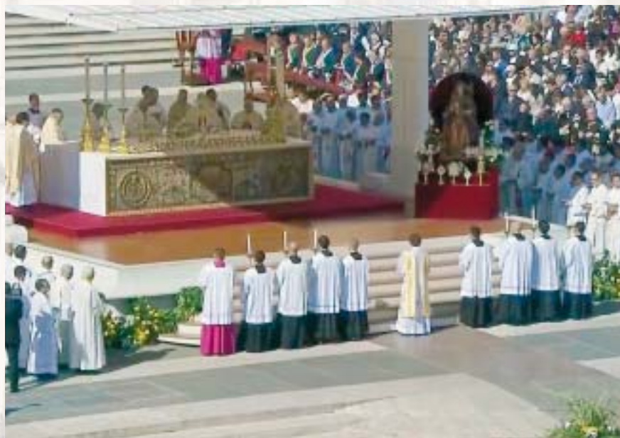
immagine della Madonna, mentre il coro della Cappella Sistina intonava il Iubilate Deo . Il ringraziamento del cardinale Prefetto e l’ordine del Papa di redigere la relativa Lettera apostolica sigillava, infine, il rito vero e proprio

Vergine Maria e tutti i Santi con il canto delle litanie, ha risposto con la formula di canonizzazione letta in latino. Quindi le reliquie dei nuovi Santi sono state portate processionalmente e collocate accanto all’altare, sotto l’im-