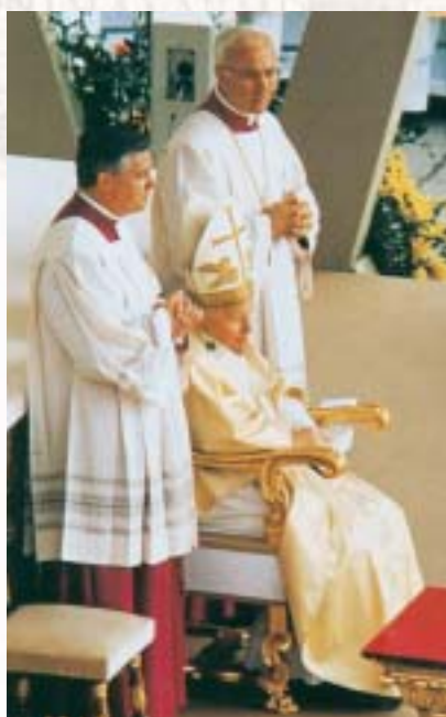
Roma, 14 aprile 2002. In piazza s. Pietro, Giovanni Paolo II, ora santo, presiede la solenne liturgia della beatificazione di padre Lodovico Pavoni e di altri cinque venerabili.

L'inchiesta sull'asserito miracolo si è svolta nella diocesi di San Paolo del Brasile e si è con-