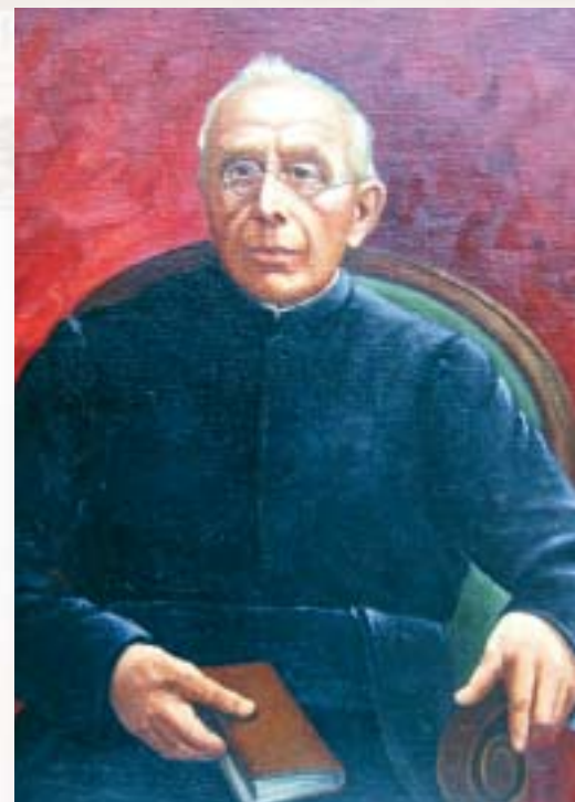
p. Giuseppe Rolandi, superiore generale che nel 1908 ha avviato la causa di beatificazione del Servo di Dio Lodovico Pavoni.

Il 26 ottobre dello stesso anno e il 4 dicembre sia i Consultori teologi, sia i Cardinali e vescovi membri della Congregazione delle Cause dei Santi si espressero affermativamente. Infine, il 20 dicembre 2001, il Papa san Giovanni Paolo II autorizzò la promulgazione del decreto con cui la guarigione era ritenuta miracolosa e avvenuta per intercessione del Venerabile Lodovico Pavoni.