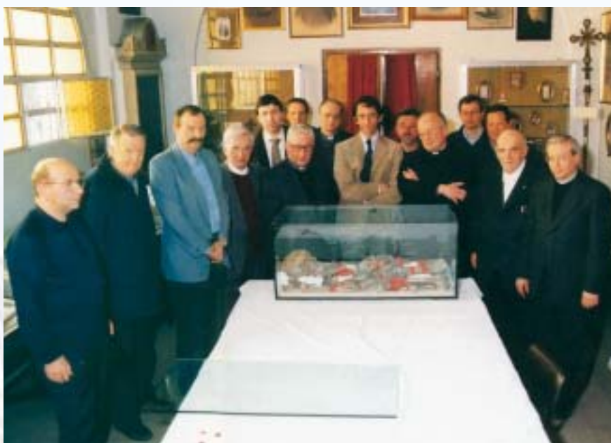
Brescia, 3 aprile 2002. Al termine della ricognizione che precede la beatificazione, i resti mortali di Lodovico Pavoni sono rinchiusi nell'urna di cristallo che alcuni mesi dopo, la domenica 27 ottobre 2002, sarà collocata nel sarcofago sotto la statua dell'Immacolata.

La beatificazione si svolse il 14 aprile 2002 a Roma, in piazza San Pietro e la memoria liturgica fissata al 28 maggio, data della prima traslazione nel Tempio dell'Immacolata di Brescia. Qui, il 27 ottobre 2002, le spoglie mortali del beato Pavoni hanno trovato sistemazione definitiva nella navata sinistra, in un nuovo bianco sarcofago, posto sotto la statua dell'Immacolata.